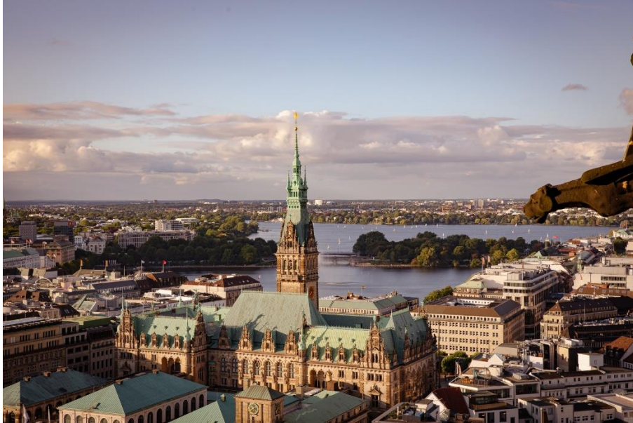
Das prachttvolle Rathaus ist aus dem Stadtbild Hamburgs nicht wegzudenken.