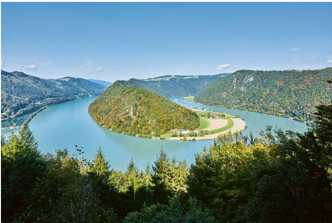
Donauengtal, Schlögener Schlinge